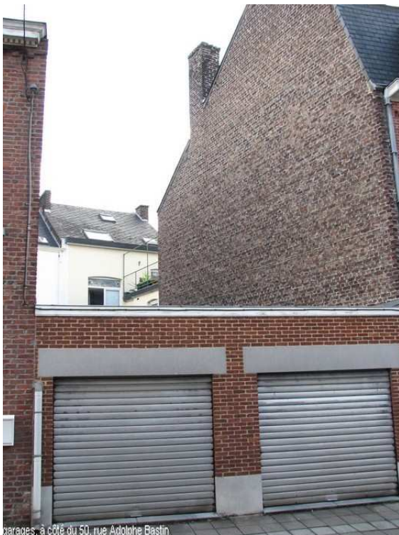
garages, à côté du 50, rue Adolphe Bastin