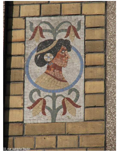
33, rue Adolphe Bastin