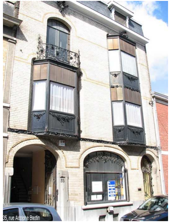
35, rue Adolphe Bastin