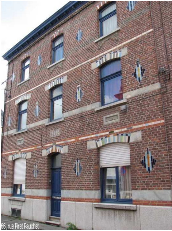
66, rue Piret Pauchet