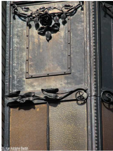
35, rue Adolphe Bastin