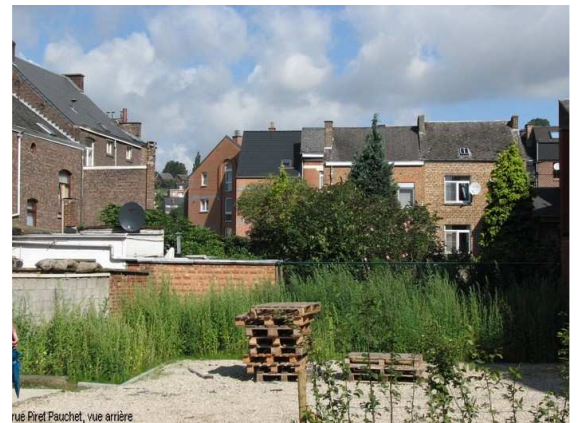
rue Piret Fauchet, vue arrière