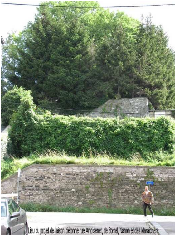
Lieu du projet de liaison piétonne rue Artoisenet, de Bomel, Nonon et des Maraichers