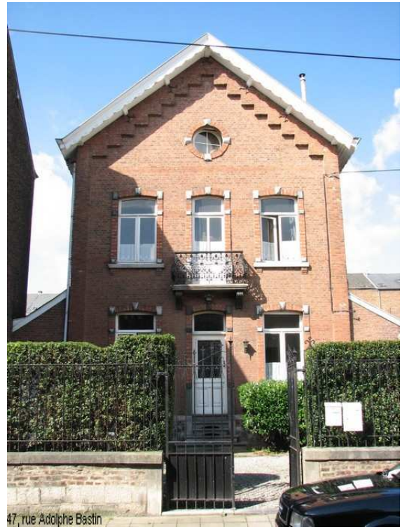
47, rue Adolphe Bastin